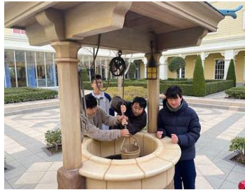
⑥食後は、ホテルの中庭を散歩しました。