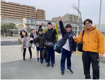
①正門前 宿泊学習スタート！