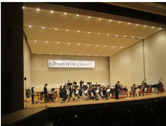
明海中管弦楽部と明海南小管弦楽部

3/14（土）、第30回ドリームウィンドコンサートが浦安市文化会館で開催され、明海中管弦楽部と明海南小管弦楽部が合同で演奏を披露しました。