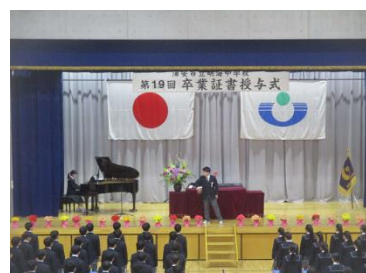
⑨全校合唱。指揮・伴奏をする3年代表生徒