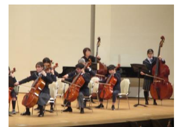
指揮者を中心に、それぞれのパートを熱心に演奏している明中生と明海南小の児童