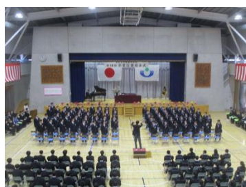
⑧卒業の歌を合唱する3年生