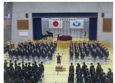
⑥送別の歌を合唱する1・2年生