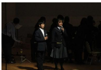
オープニングのカーションをしているようす