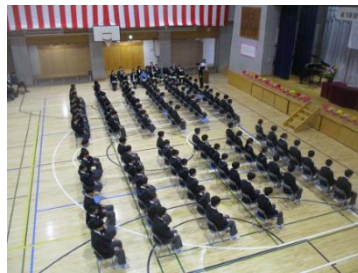
②卒業式開始。着席した3年生