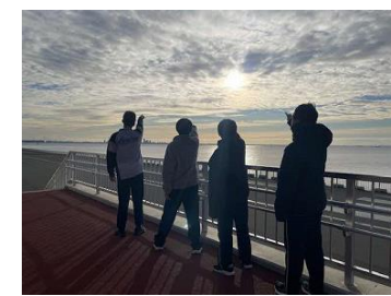
⑦朝日をバックに記念撮影。