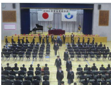
⑩式が終わり、会場を後にする3年生。それを見送る3学年担当の先生たち。見守る保護者の皆さん。