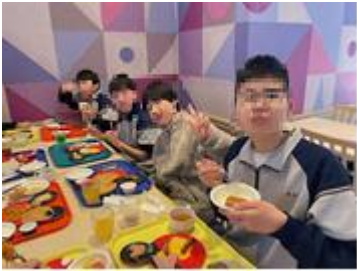
⑤宿泊施設の近くのホテルで朝ごはん。（朝食バイキング）