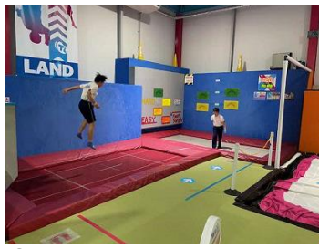
②市内の運動施設 明海南小なのはな学級の小学生たちも合流し、一緒に運動を楽しみました。