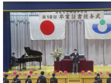
③校歌斉唱。指揮・伴奏をする3年代表生徒