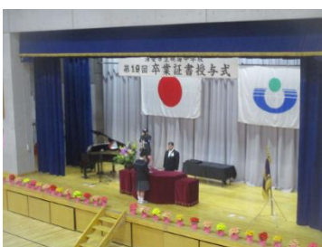
⑦答辞を述べる3年代表生徒