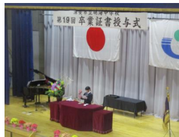
⑤送辞を述べる2年代表生徒