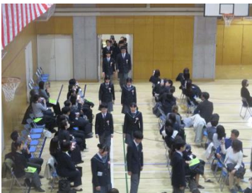
①式場に入場する3年生