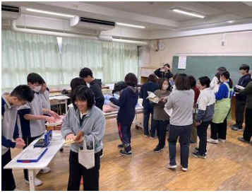
③運動の後は、明海小学校に移動し、頒布会を行いました。