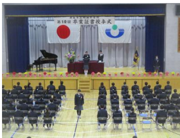
④卒業証書を授与する3年生