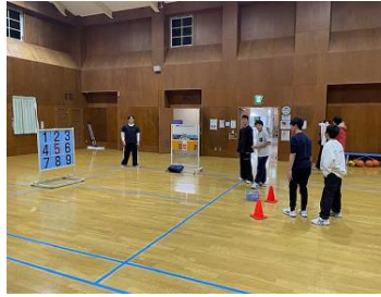
④夕食後は、宿泊施設の体育館や和室でレクを楽しみました。