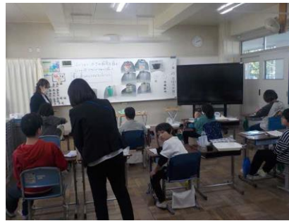
授業研究会(すずらん学級)