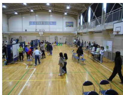
東野小との交流(4年)