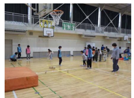
富岡フェスティバル(6年)