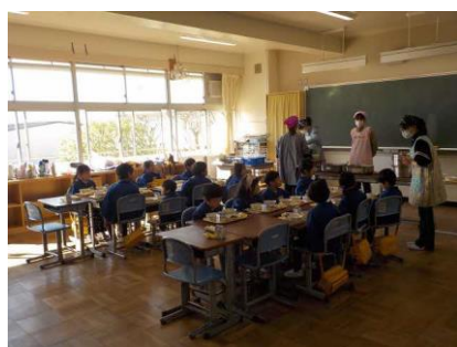
給食体験(富岡幼稚園)