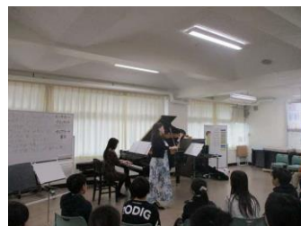
ミュージックデリバリー(5年)