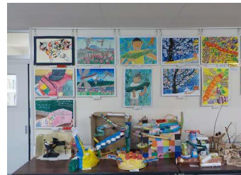
浦安市子ども作品展に出店した作品(1階に展示中)