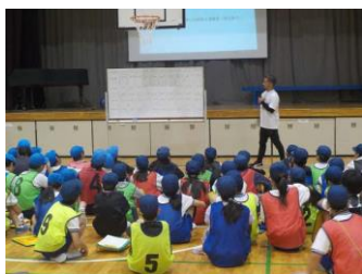
キャリア教育(5・6年)