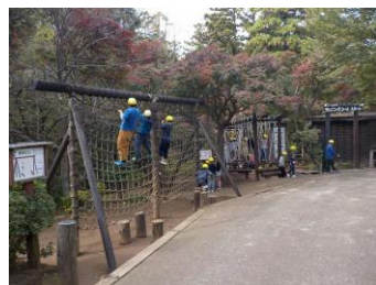
ありのみコース(3年)