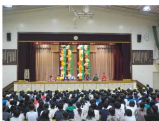
校内発表会(すずらん)