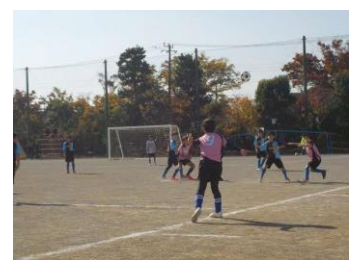
市内サッカー大会