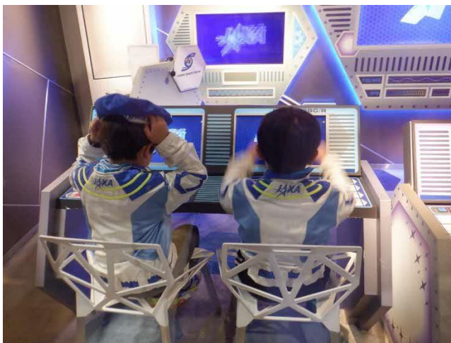
スペースセンタークルー