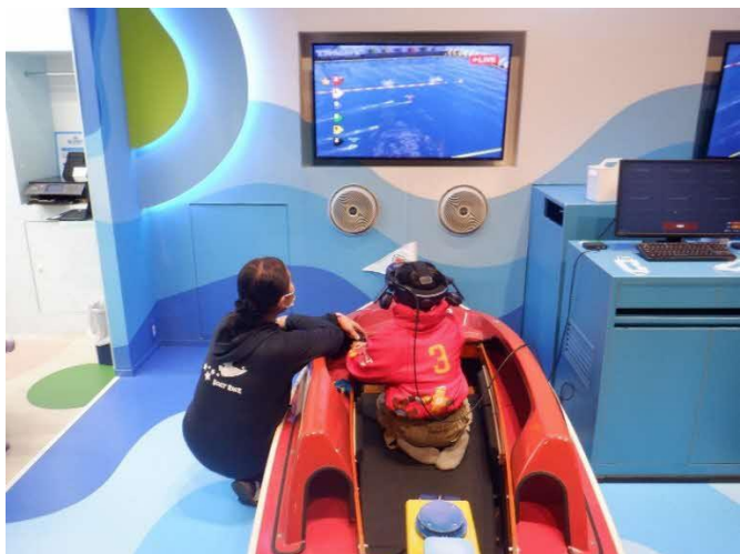
ボートレーサー レースをして順位で賞金をもらいます