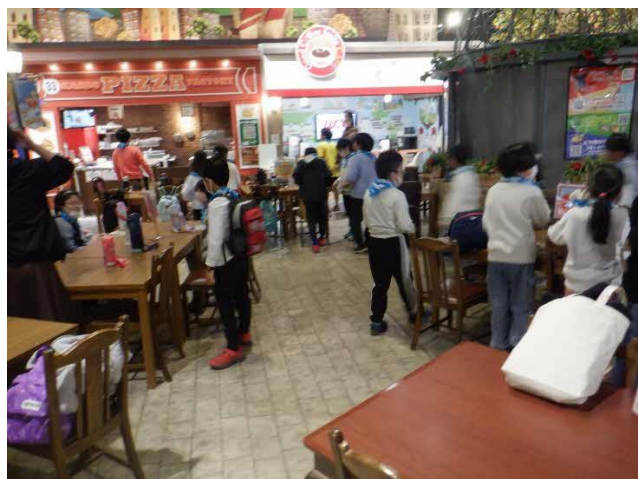
荷物を席に置いたら 10 時スタートです。

予約が必要な職業と予約がなくてもすぐできる職業があります。10 個くらい体験した児童も数名いました。