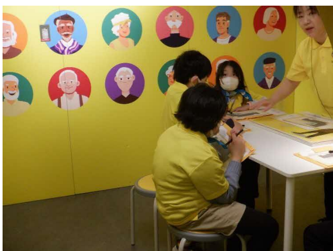
シニアケア相談員