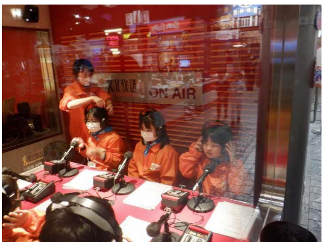
ラジオパーソナリティー