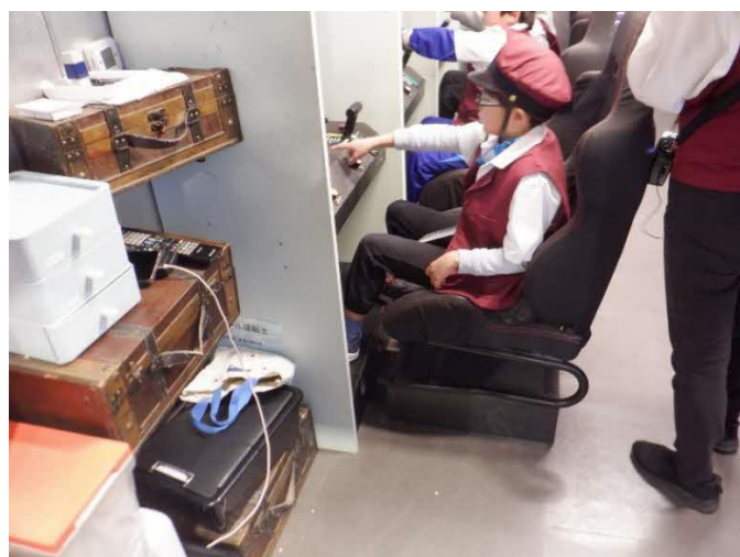
モノレール運転士 シュミレーターで運転体験をします