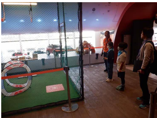
ドローン操縦士 ドローンを運転して輪をくぐります