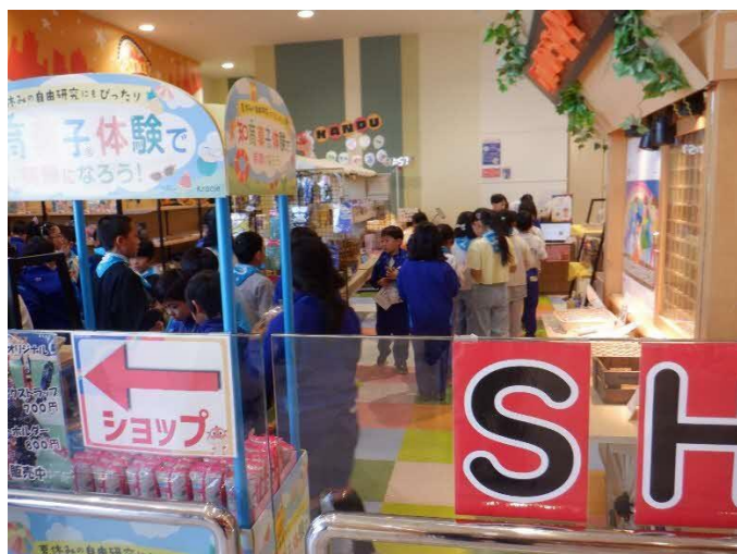
集合時間前、混んでいます。