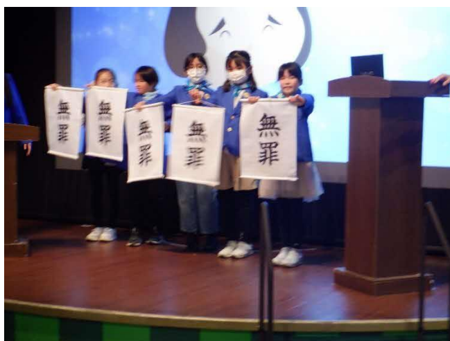
弁護士 模擬裁判を行い、無罪を勝ち取ります