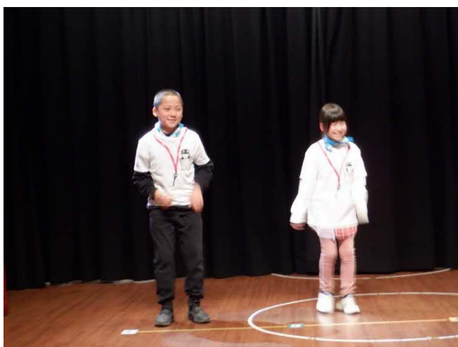
ダンサー 舞台上で踊ります