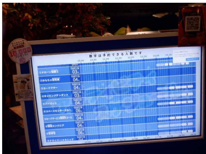
画面で予約状況を確認できます