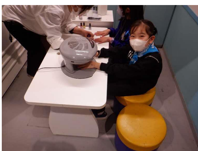
カッチンでネイルを塗ってもらうこともできます (一日で色が落ちてしまうネイルですが)