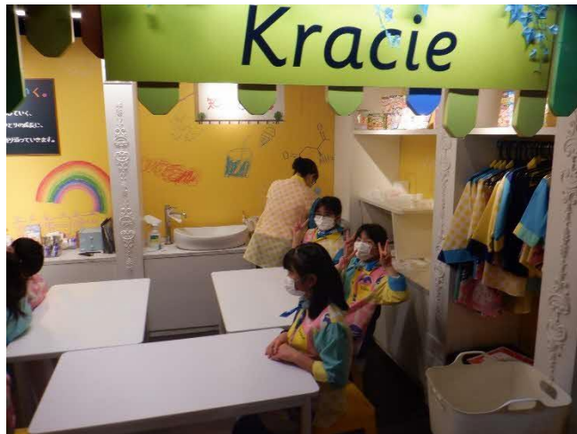
お菓子クリエイター