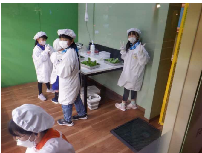
植物工場スタッフ 野菜を収穫して持ち帰ります