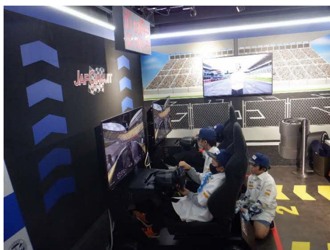
カーレーサー レースをして賞金をもらいます。