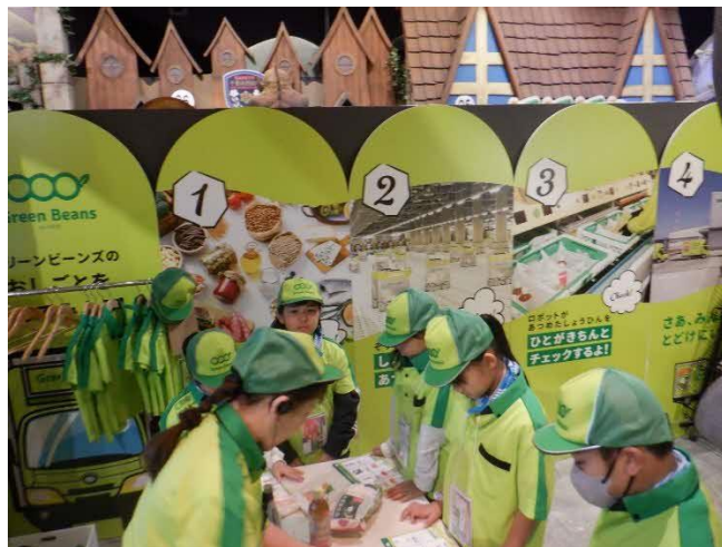
ピックアップクルー