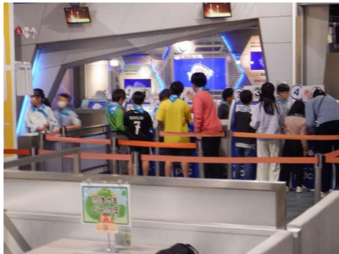
30分たつと次の予約ができます。