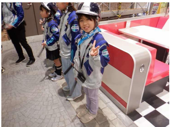
警備会社 パトロールして不審者を探します