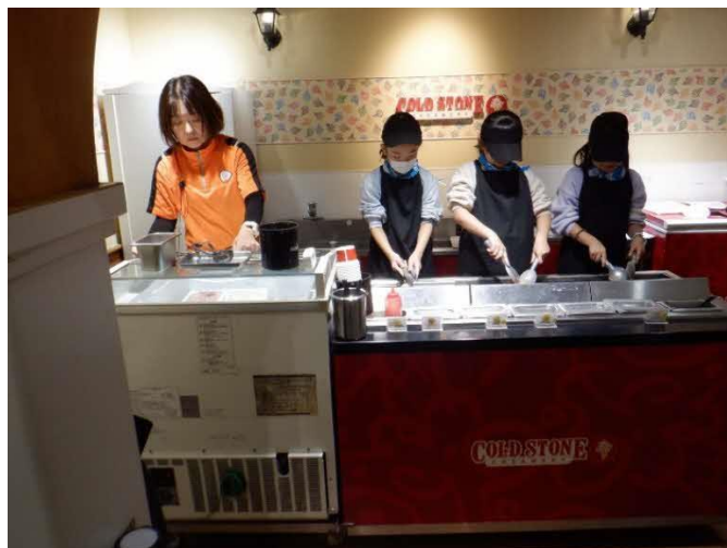
アイスクリームメーカー アイスクリームを救ってトッピングします。