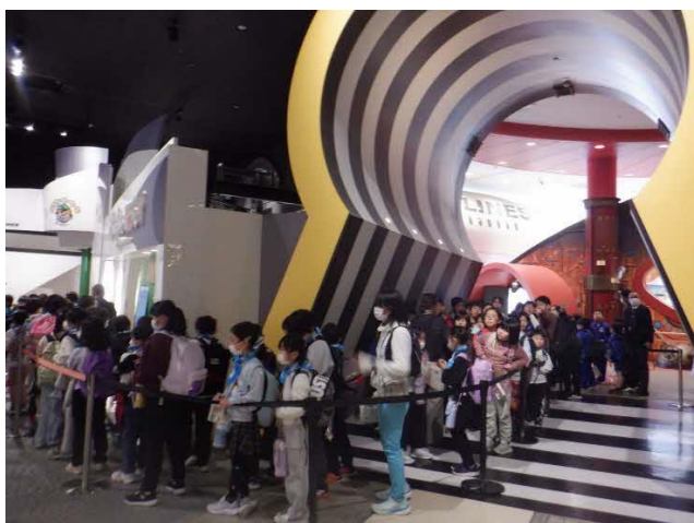
最初の仕事を予約します。