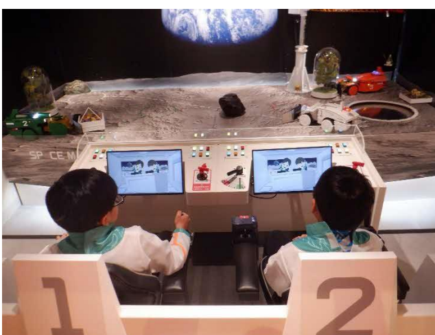
月面基地開発 クレーンを動かして物資を運びます