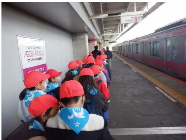
ホームでの移動も素晴らしいです。