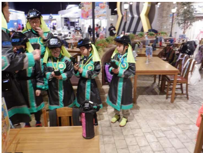
イマーシブファイアーファクター 火災の発生しそうなところを探します