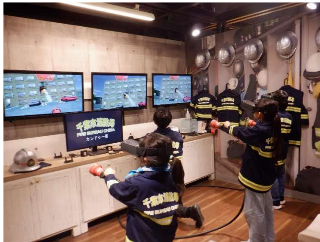
消防士 ビルの火事を消します