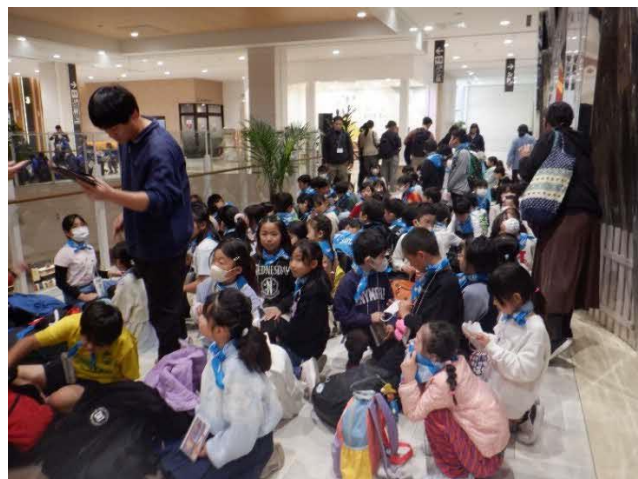
入場前、この後クラス写真を撮りました。