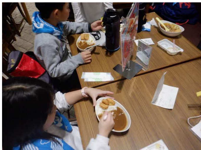
ナゲットがのっています