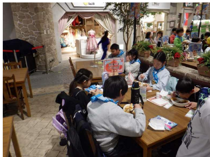
食べ終わった人から次の仕事に行きます