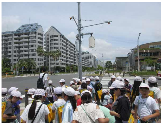
堤防沿いを戻ります。