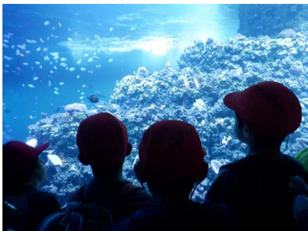
世界の海のコーナーです。