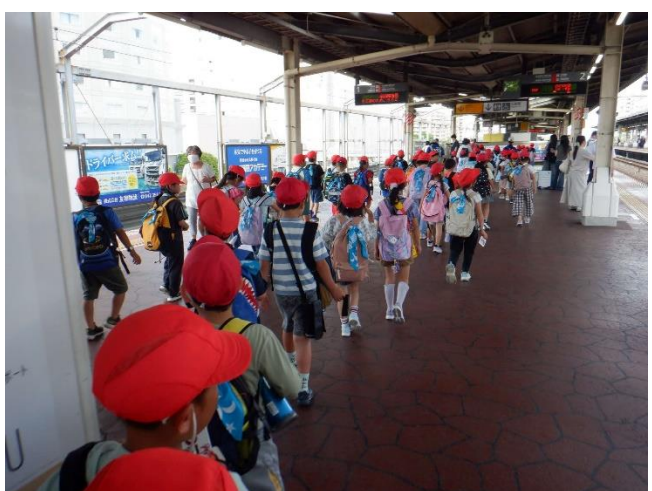
新浦安につきました。