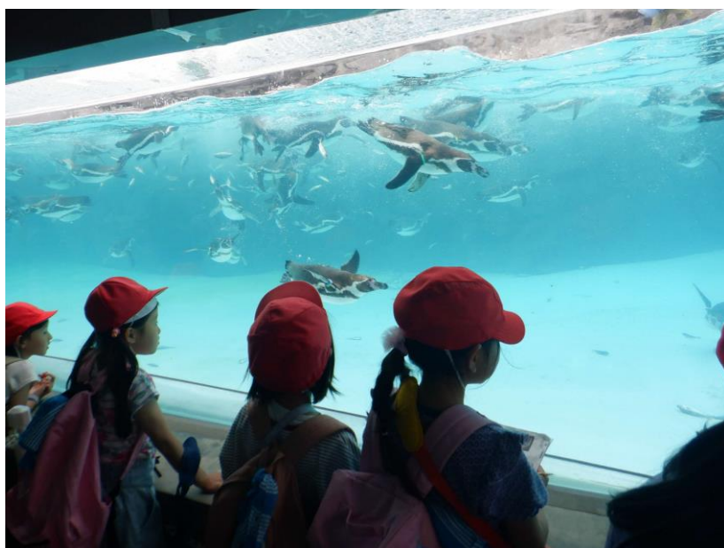
ペンギンのエサやりの時間です。魚を尻尾から飲み込みます。