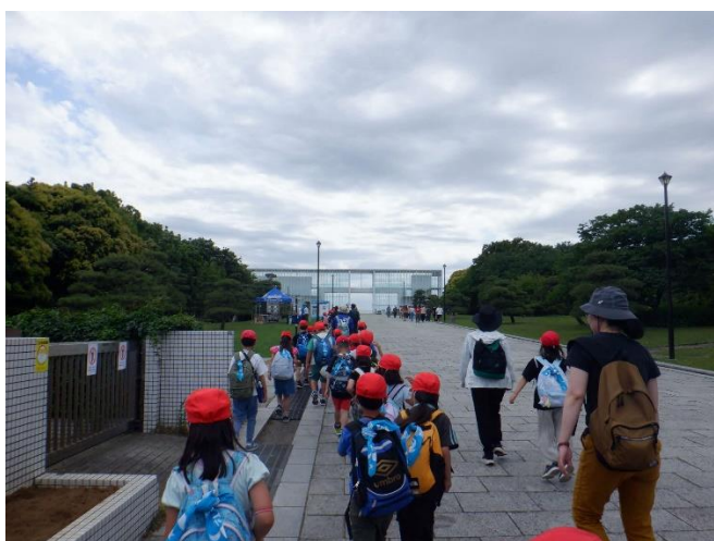
広場に向かいます。