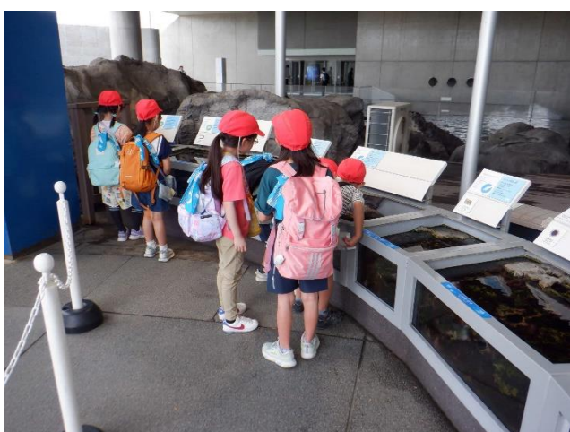
ウツボの水槽に手を入れてはいけません。