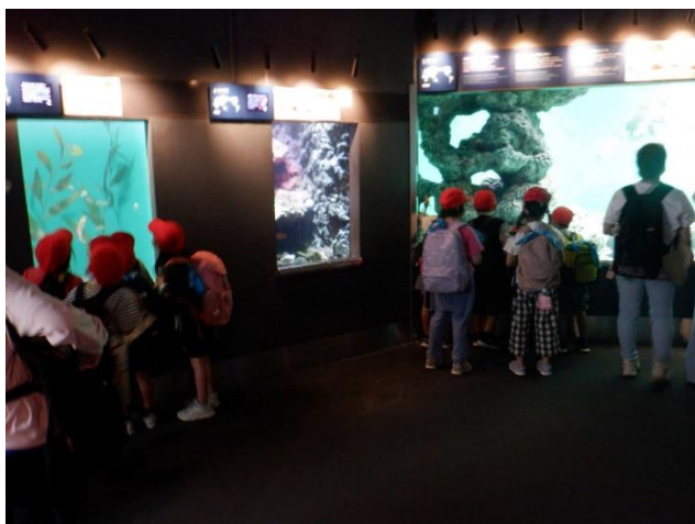
いろいろな魚がいます。