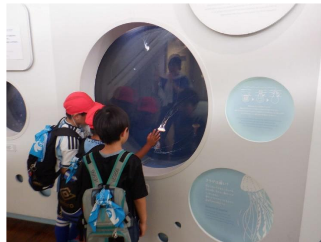
クラゲのコーナーです。絶対素手はやめましょう。