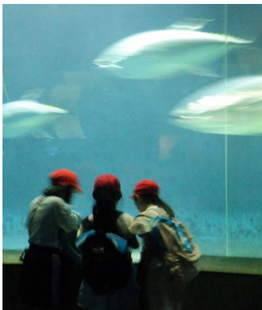
マグロはうまく写真に写りません。