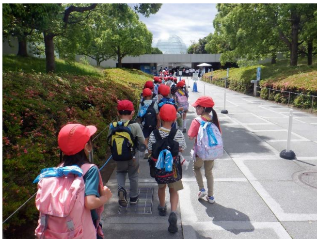
水族園に向かいます。