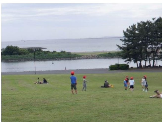
広場では、お菓子を食べる人と遊ぶ人に別れました。