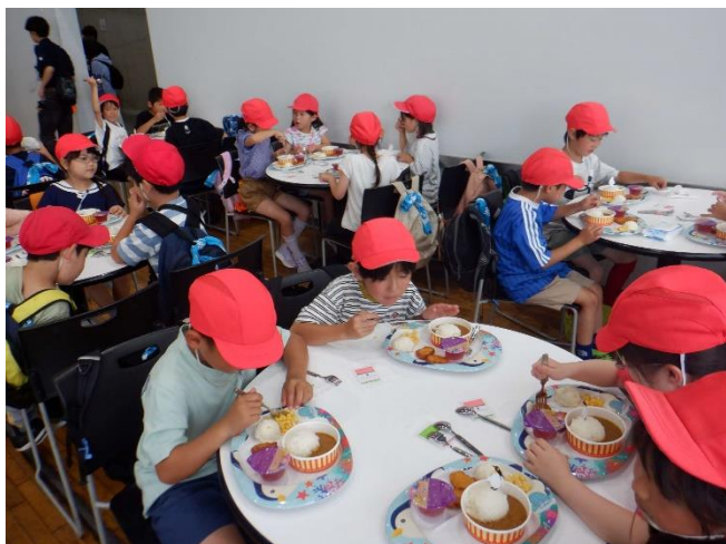
お昼はカレーです。