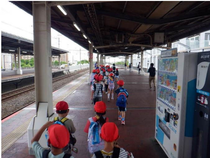
ホームまで来ました。