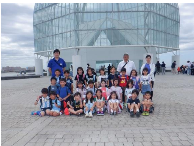
1組からクラス写を紹介します。