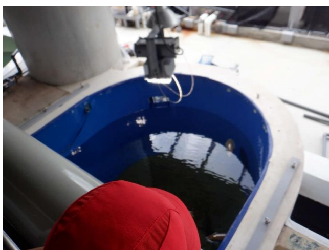
イカが泳いでいます。