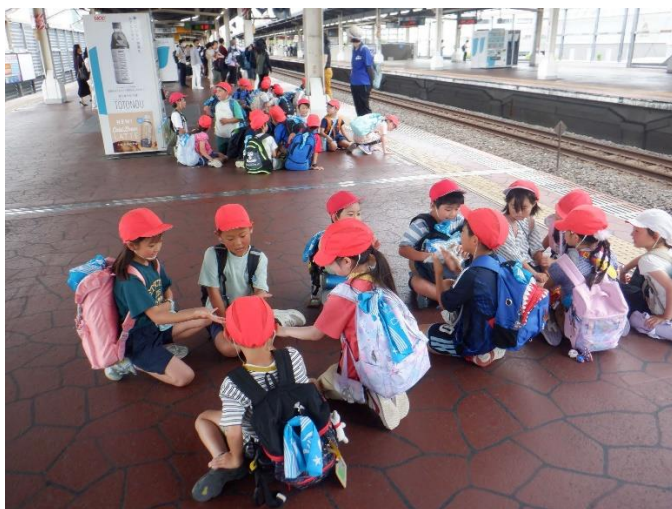
ホームでじゃんけんはしません。