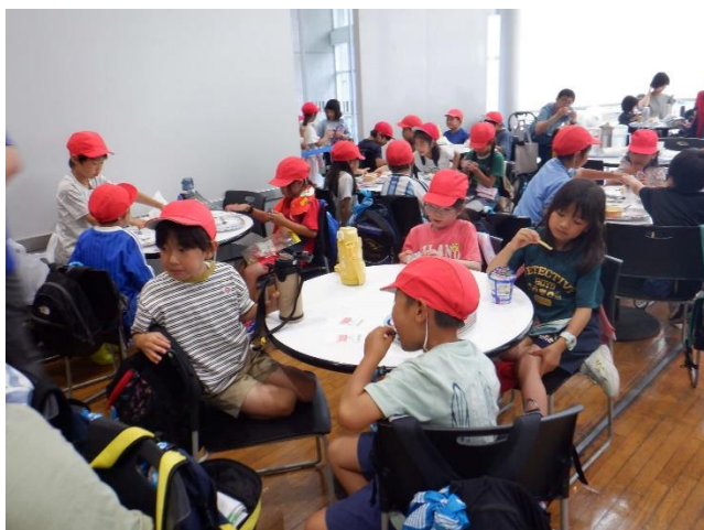
食べ終わった人は、お菓子も食べています。