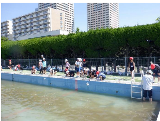
捕まえたヤゴを見て(自慢して)います。